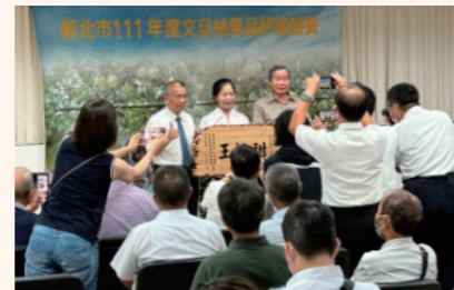
文旦柚果評鑑暨展售活動