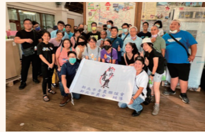
青年農民標竿研習