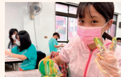
四健會員日-繽紛流動活動