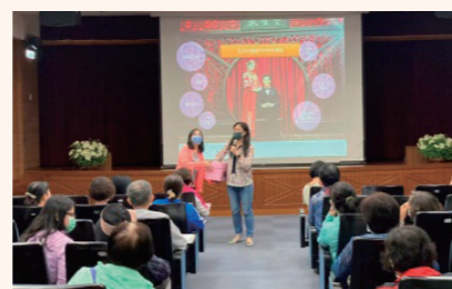
「性別平等及溝通技巧」講習