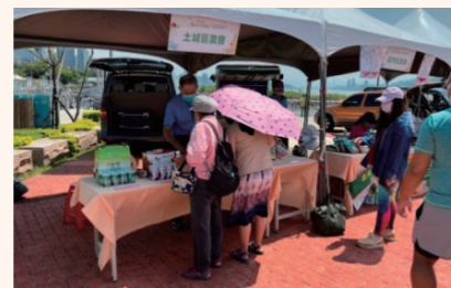
全國大南瓜評鑑表揚暨展售活動