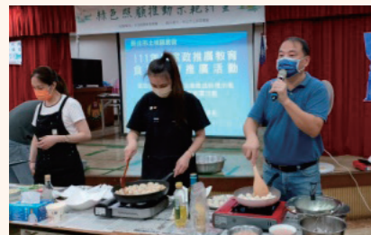
家政班食農教育推廣講習活動