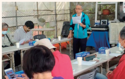
農事技術研究班幹部會議