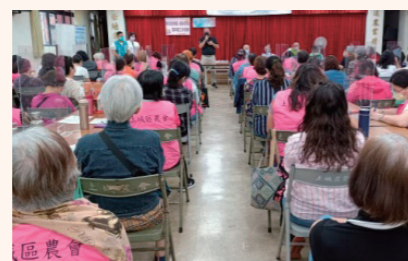
家政班班長、義指研習暨年度工作會報