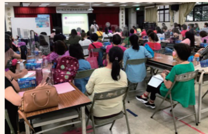
家政班書記工作研討會