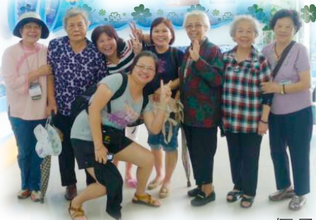
參觀通霄精鹽場-鹽來館