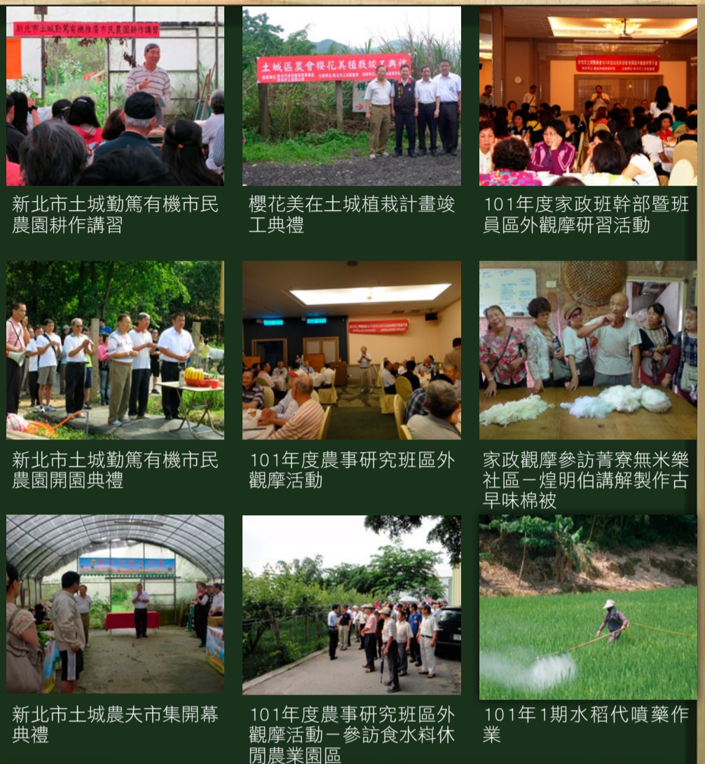
新北市土城區有機市民農園耕作講習