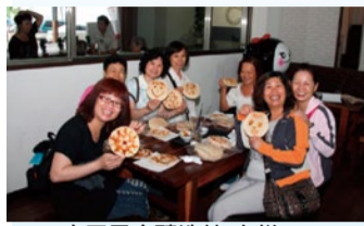
大同黑金釀造館-米餅DIY