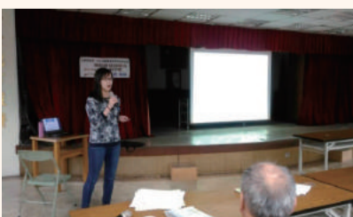
農事幹部會議會後辦理健康講座