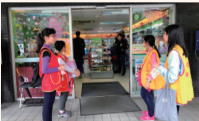
四健公共服務-街頭勸募發票活動