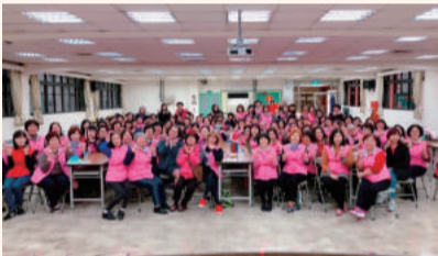
家政班班長、義指年度工作會報班長合影