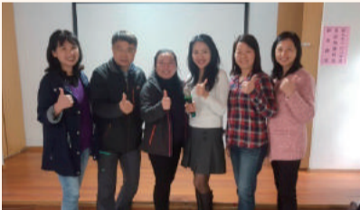
參加新北市家政推廣教育幹部講習