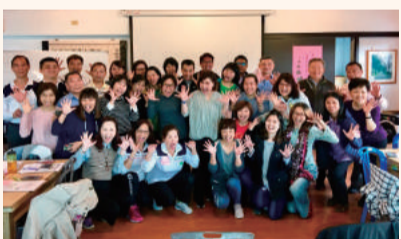
參加新北市四健義指暨會員研習