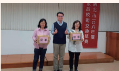
參加新北市家政推廣教育技術交換大會，公民常識測驗獲亞軍