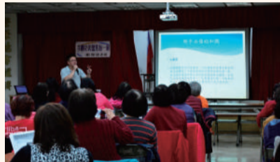
家政班書記工作研討會-手機攝影講座