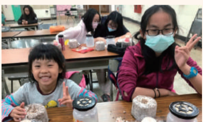
四健會員日「菇菇世界」