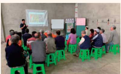
認識農藥及如何安全使用農藥講習