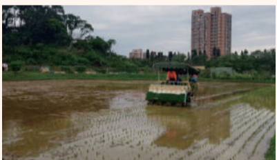
108年1期代耕作業計畫