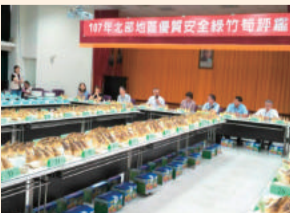
北部地區優質安全綠竹筍評鑑