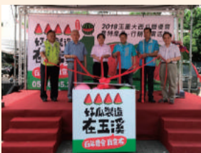
玉里大西瓜暨優質農特產品行銷推廣活動