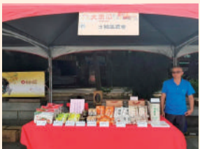
參與107年度新北市全國大南瓜比賽，農特產品展售活動