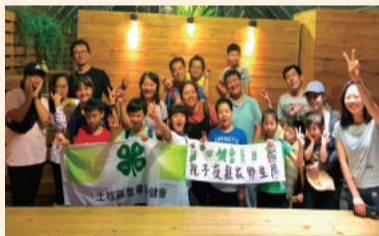
四健親子夜觀家鄉生態活動