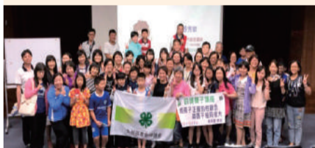
四健兩性親子講座