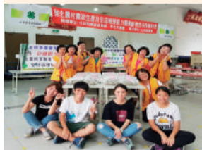
粽夏飄香～舞端陽、家政四健粽動員