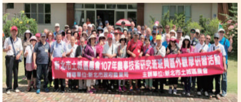
農事研究班班員區外觀摩研習活動