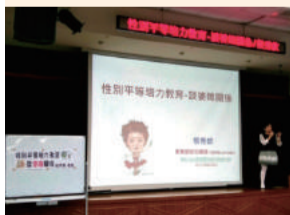
家政性別平等講座