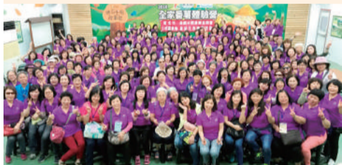
家政幹部暨義指觀摩研習活動