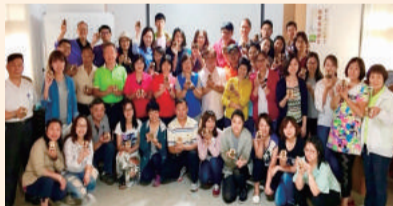
四健推廣教育義務指導員研習