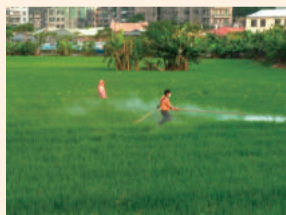
本會轄區水稻代噴藥作業情形