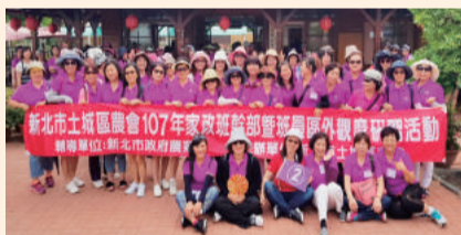
家政班幹部暨班員區外觀摩研習活動