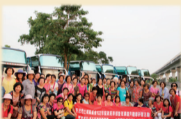
家政觀摩活動~十鼓橋糖文創園區合影