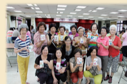
高齡者結業式暨成果展~蝶谷巴特輕鬆做筆筒