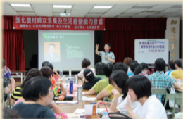
9/17家政講習會~冬季保養之道一解開酵素抗氧化的密碼