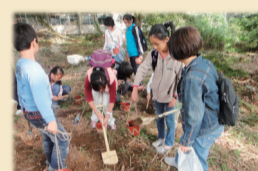
10/27四健會會員公共服務暨農業體驗活動