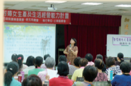
9/25家政講習會~自信的女人最美麗