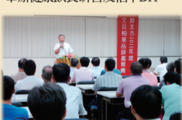
9/12參加新北市農會102年文旦柚果品評鑑。