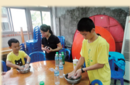
10/19參加新北市農會於文山農場舉辦健康飲食研習及稻草DIY。