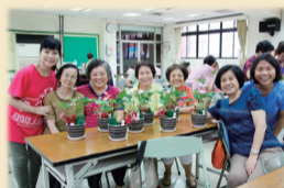
高齡者上課~溫馨盆栽動手做