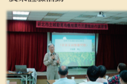
10/5動篤有機推廣市民農園耕作講習會