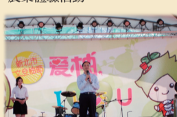
9/14及9/15新北市文旦柚節於八里左岸設攤推廣農特產品。