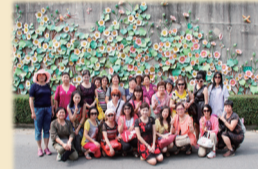
家政觀摩活動~板陶窯社區合影