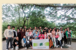
10/27四健會會員公共服務暨農業體驗活動