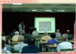
11/12辦理入侵紅火蟻教育講習會