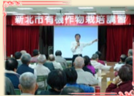
11/26辦理新北市有機作物栽培講習會