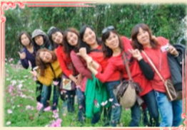
11/22家政班幹部觀摩活動