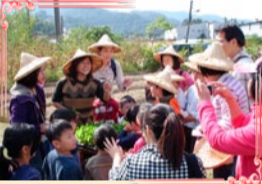
12/07一日農夫，農耕真有趣