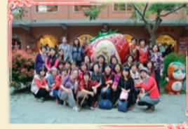
11/22家政班幹部觀摩活動