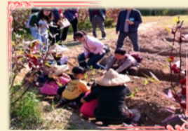
12/07一日農夫，農耕真有趣