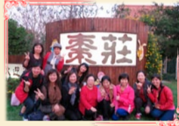
11/22家政班幹部觀摩活動