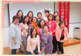
新北市102年度家政指導員及班員講習會